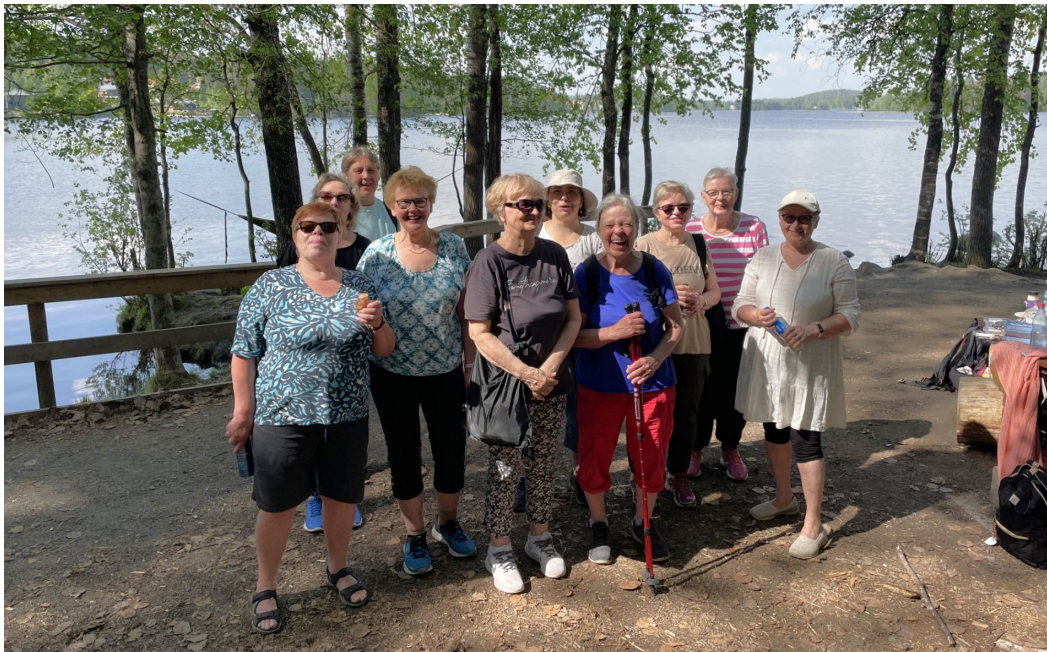
Jyväskylän nivelpiiri ulkoili Haukanniemessä toukokuussa.

Jäsenistön palveluksessa toimivat vapaaehtoisina sosiaaliturvan erityisasiantuntija sekä potilasvahinkoasiamies.