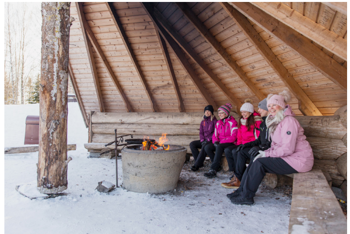
Härmän kylpylän nuotiokota.

Kaikkea yhdistyksen lomatoimintaa koordinoi vapaaehtoistyötä tekevä lomavastaava Raija Rapo .