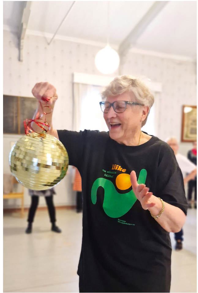
Forssan nivelpiiri järjesti Niveldiskon marraskuussa.

Toiseksi alatavoitteeksi on kirjattu Verkko-koulutus tarjoaa vapaaehtoisille yhdenvertaiset mahdollisuudet osallistua paikasta riippumatta. Uusien verkkokoulutusmahdollisuuksien toteuttamiseksi hankekoordinaattori ja jäsensihteeri osallistuivat Siviksen Vapaa-ehtoisjohtaja-verkkokoulutukseen. Suomen Nivelyhdistys voi jatkossa toteuttaa koulutuksen itse.