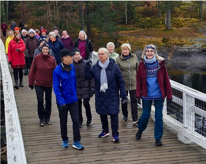
Suomen Nivelyhdistyksen vapaaehtoisia koulutus- ja virkistysviikonloppuna Savonlinnassa.

Toivo-vertaistukisovellus on OLKA-toiminnan koordinoima palvelu, joka tarjoaa vertaistukea ja tietoa sairastuneille, vammautuneille ja heidän läheisilleen. Vuonna 2024 Toivo-sovelluksessa toimi kuusi Suomen Nivelyhdistyksen koulutettua Toivo®-vertaistukijaa.