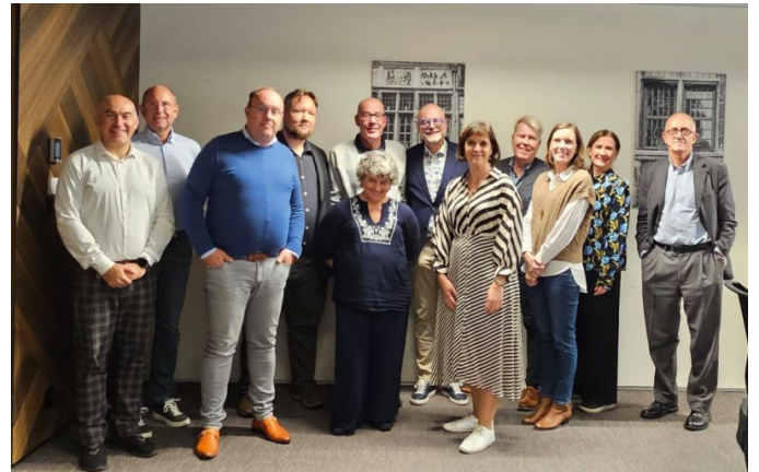
Eurooppalaisen artroosia sairastavien potilaiden kattojärjestön perustamiskokouksen osallistujia Brysselissä lokakuussa.

NetwOArk – Patient Council; The European Network on Osteoarthritis -verkoston keskeisin tavoite on valvoa, että nivelrikkoa eli artroosia sairastavien potilaiden tarpeet ja kokemukset tulevat huomioituksi, kun lääketieteellistä tutkimusta ja hoitoa suunnitellaan ja kehitetään.