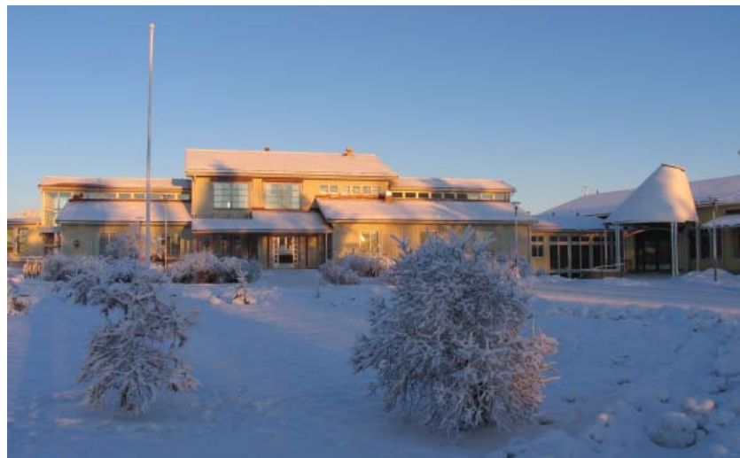
Kansanlääkintäkeskus talven pimeimpänä päivänä joulukuussa.

Maansäteily on ilmiö mihin sukupolvi toisensa jälkeen on halunnut uskoa, kunnes tieteellinen tutkimus on osoittanut, että ilmiötä ei ole olemassa. Viimeisen suomalaisen tutkimuksen toteuttivat Mela ja Kari-Koskinen 1980-luvulla. Tutkimuksen murskaavista tuloksista huolimatta monet kansalaiset nukkuvat paremmin kuparilevy sänkynsä alla tai